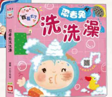
《我長大了：忍者兔刷牙》 《我長大了：忍者兔洗澡》