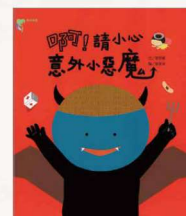
《啊！請小心意外小惡魔》