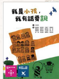
《我是小孩·我有話要說》