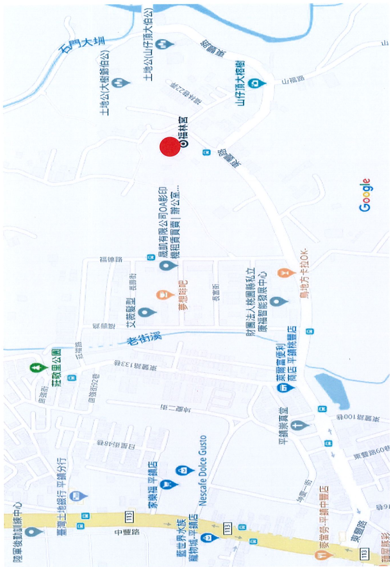
附件三 比賽地點位置示意圖