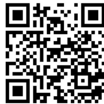
研習評量 Google 表單

(八) 請國、英、數、自、社領域討論是否需要 TEAMS Lite 雲端平台新增功能之教育訓練，將採分領域實施， 安排一節課研習於領域時間。