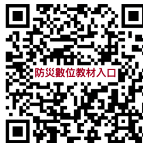
防災數位教材入口

本計畫所開發之防災數位教材已公開，目前開發災害類型包含「地震災害」及「地質災害」，歡迎掃描右方 QR code 或下列網址免費取用： https://linktr.ee/dmoetw01