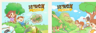
第一本「出門走走吧」 第二本「戶外教學篇」

開發 4 本 AR 繪本「地震來了！」，提供 AR 技術進行地質災害境況模擬技術，享受立體視覺浸淫體驗，以建立學生面對災害時的思維能力與判斷能力，進一步深化防災知識技能。