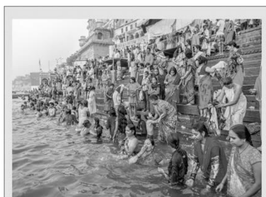
地點：恆河旁 拍攝說明：因為宗教上的信仰，當地人們會用恆河水沐浴淨身