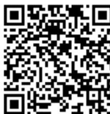
教師報名 QR code